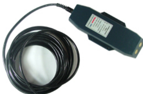
超声波多普勒原理高精度速度流量计