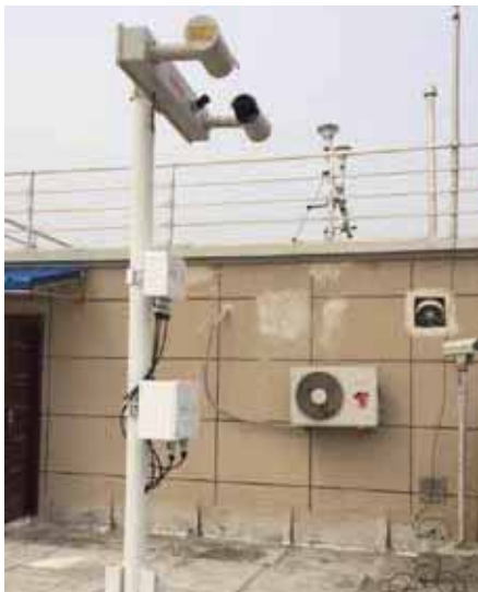
2104 年湖北丹江口环保局引入华创维想 VM910 用于灰霾监测。