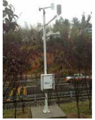
能见度在武汉海事局监测海洋天气 能见度在交通天气站上的应用