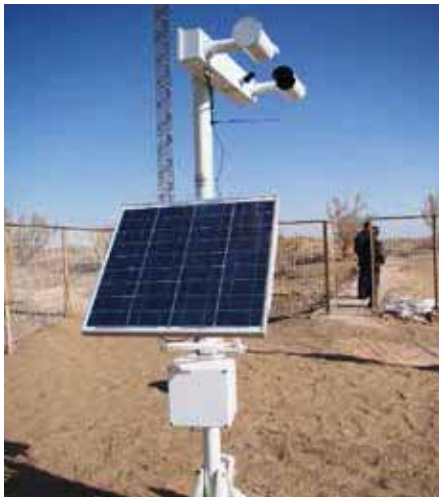
2010 年北京林业局引入华创维想 VM910 用于扬尘监测。