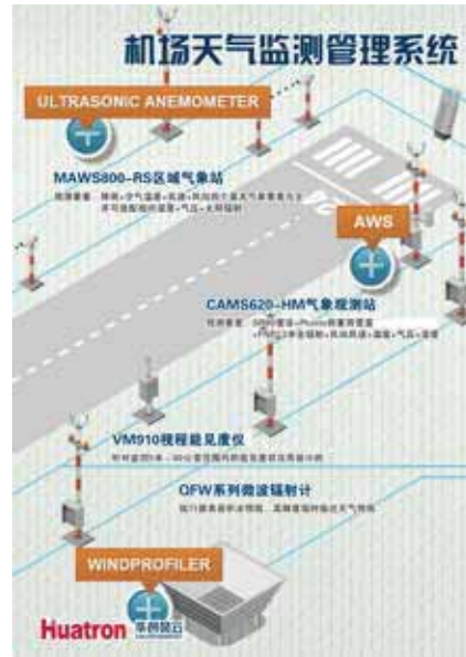
Huatron 机场天气监测管理系统

机场能见度对飞机的起飞和着落安全极为重要，因此能见度保障是机场飞行气象保障的一项重点内容。