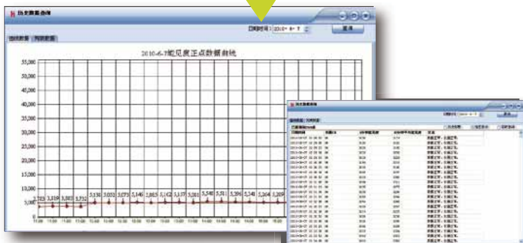
历史数据查询（曲线数据）